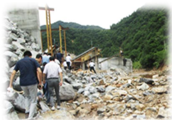
佛坪 6.29 水毁现场