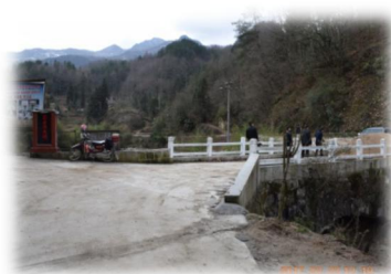
南郑水磨村新建的慈安桥