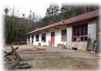
南郑法镇新建的民房